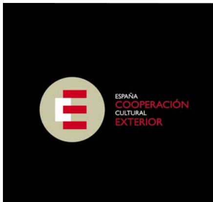
Embassy of Spain in Canada