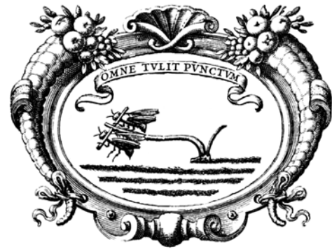
GRISO (Golden Age Research Group of the Universidad de Navarra)