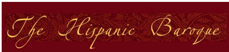
The Hispanic Baroque Project of The University of Western Ontario